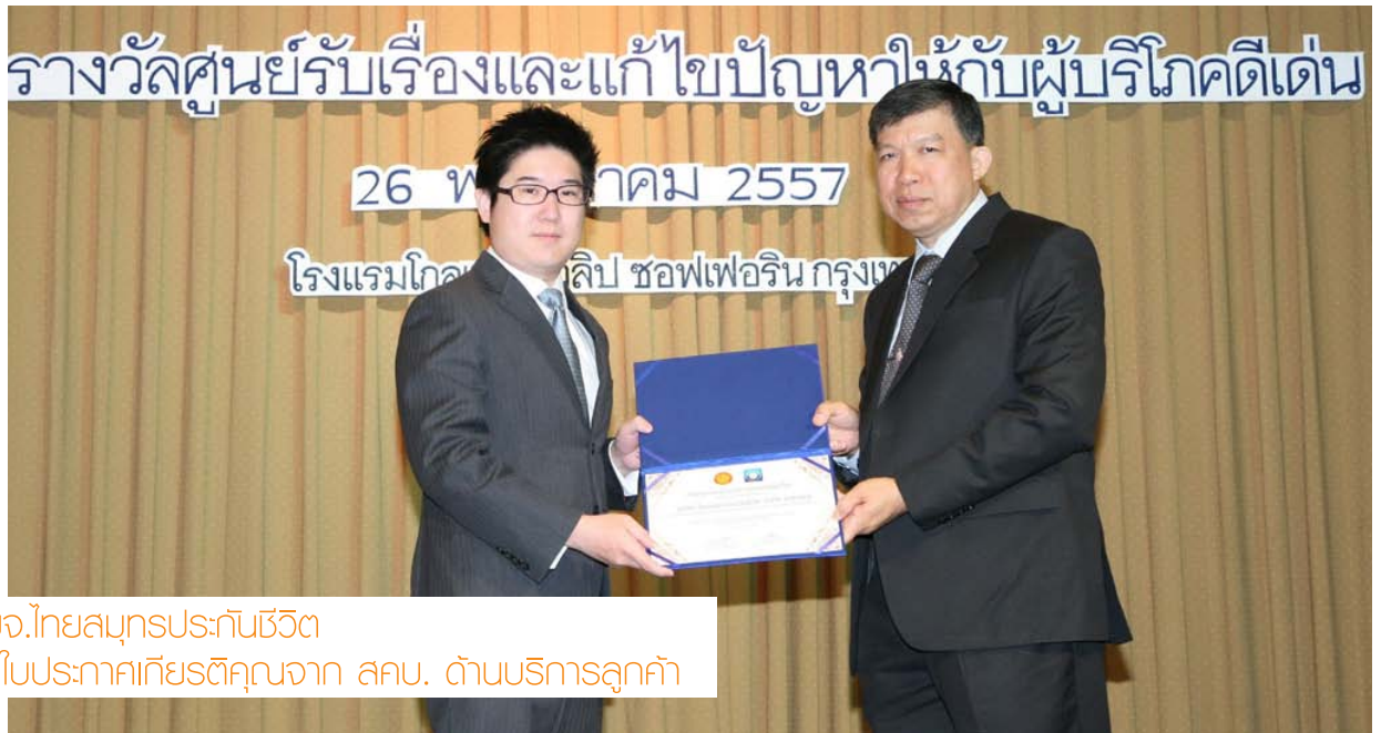
บมจ.ไทยสมุทรประกันชีวิต รับใบประกาศเกียรติคุณจาก สคบ. ด้านบริการลูกค้า

มูลนิธิพระดาบส ก่อตั้งโดยพระบาทสมเด็จพระเจ้าอยู่หัว เพื่อส่งเสริมและสนับสนุนให้ผู้ด้อยโอกาสที่มีความตั้งใจจริง มีศรัทธา ขวนขวายหาความรู้เป็นวิชาชีพใส่ตน สามารถมีอาชีพติดตัวเพื่อดำรงชีวิต และดูแลครอบครัวได้อย่างเป็นสุข